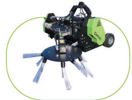
CEPILLO ALINEADOR HIDRÁULICO