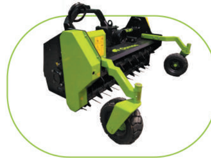
RUEDAS DELANTERAS MACIZAS