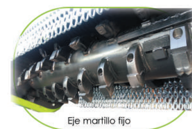
Eje martillo fijo