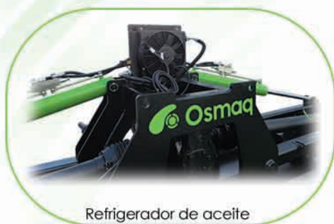
Refrigerador de aceite